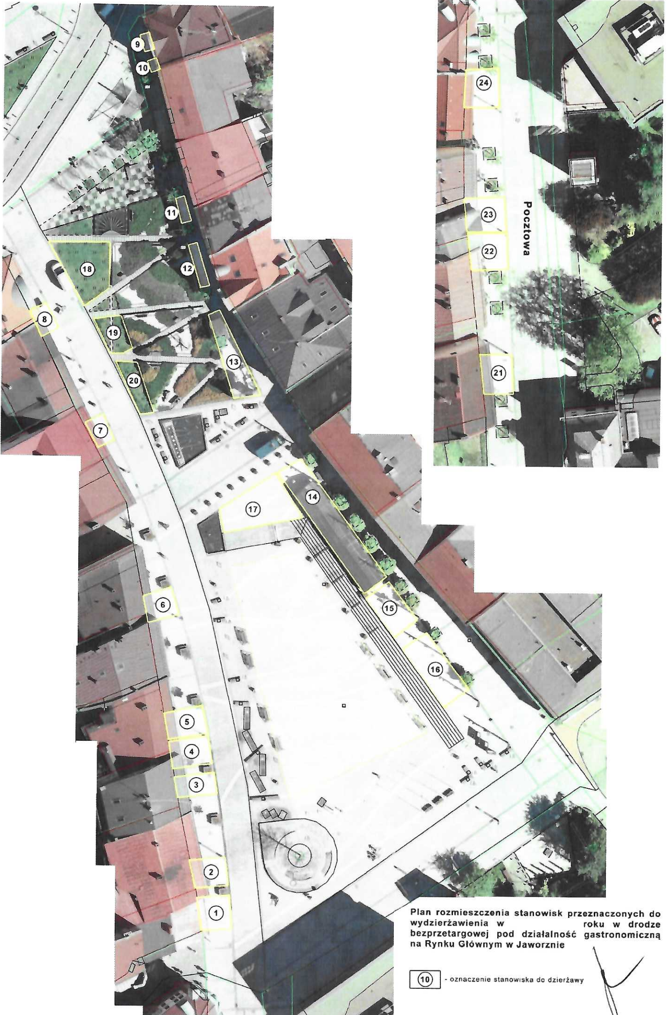
Plan rozmieszczenia stanowisk przeznaczonych do wdzierzawienia w roku w drodze bezprzetargowej pod dzialalnosc gastronomiczna na Rynku Glownym w Jaworznie

(10) - oznaczenie stanowiska do dzierzawy